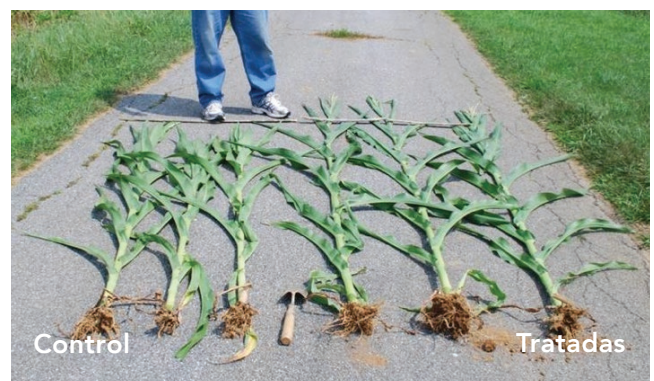
Nótese el tamaño de la masa radicular, circunferencia del tallo y altura de las plantas tratadas. También, la planta tratada ha comenzado a sacar panoja mientras que el control sigue creciendo.

Para más información visite GrowQuantum.com o llame al 866.871.0154.